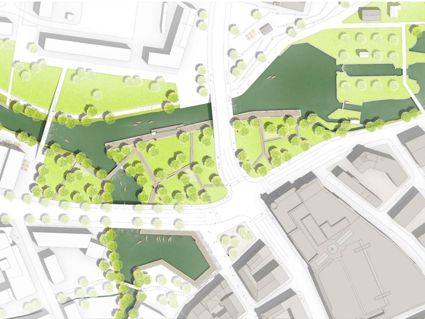
_LAGEPLAN (ORIGINAL: M. 1/500)

DER PARKCHARAKTER ORIENTIERT SICH AM VORGEFUNDENEN. ALS UFERPARK WIRD DIE VORHANDENE, NATURRÄUMLICH TYPISCHE UND Z.T. SKURILE VEGETATION ERHALTEN UND ERGÄNZT. MEHRSTÄMMIGE GEHÖLZGRUPPEN AUS ERLLEN UND BIRKEN PRÄGEN DEN UFERPARK UND LEITEN SELBSTVERSTÄNDLICH IN DIE NATURNAHE UFERVEGETATION VON SCHWÄRZE UND FINDWKANAL ÜBER. GROSSZÜGIGE WIESENBEREICHE UND UFRSAUMZONEN AUS GRÄSERN UND KRÄUTERN DER FEUCHTEN BIS FRISCHEN ZONE UNTERSTREICHEN DIE SPEZIFISCHE ATMOSPHÄRE DES STADTUFERPARKS. EIN NETZ AUS LEICHT ERHÖHTEN WEGEN STellt DIE BISHER FEHLENDEN ANKNÜPFUNGEN AN DEN UMGEBENDEN STADTRAUM HER. AUFENTHALTSBEREICHE FÜR SPIEL, PICKNICK, RUHE UND ERHOLUNG LADEN DEN ZU FUSS, MIT DEM SCHIFF, DEM BOOT ODER DEM FAHRRAAD ANKOMMENDEN BESUCHER ZUM VERWEILEN EIN - DER STADTUFERPARK EBERSWALDE WIRD ZU EINER TOURISTISCHE ANLAUFSTELLE UND ZU EINEM ETAPENZIEL DER ERLEBNISREGION 'FINDWKANALZONE'.