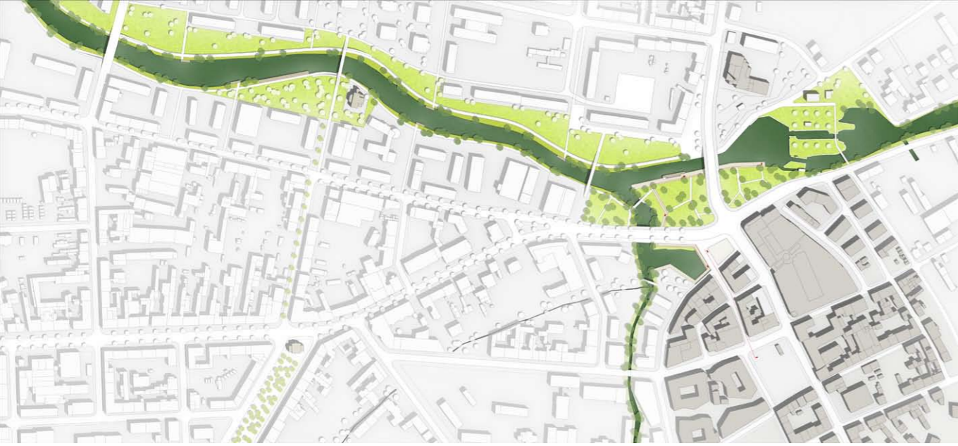
_LAGEPLAN (ORIGINAL: M. 1/1.000)