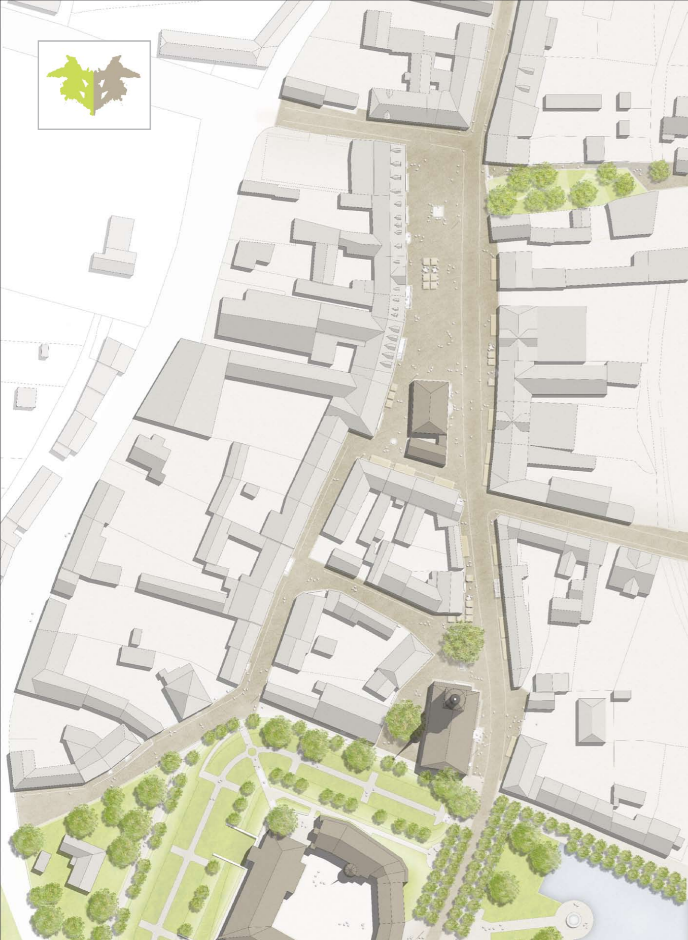
_LAGEPLAN (ORIGINAL: M. 1/250)

AUSLOBER: GOETHESTADT BAD LAUCHSTÄDT; REALISIERUNGSWETTBEWERB; GRÖSSE: 1,0 HA;