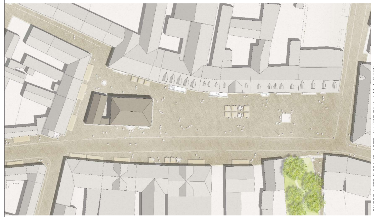
_AUSSCHNITT_GESAMTLAGEPLAN (ORIGINAL: M. 1/250)